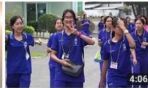
ค่ายวิทยาศาสตร์ โรงเรียนเบญจมราชรังสฤษฎ์ จังหวัดฉะเชิงเทรา 79 views • 2 months ago