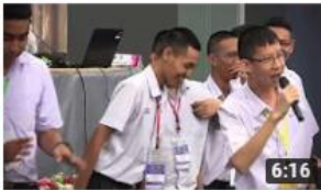
โอลิมปิกวิชาการ สอวน. ค่ายที่ ๒/๒๕๖๐ มหาวิทยาลัยบูรพา 132 views • 1 month ago