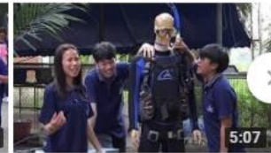
ค่ายวิทยาศาสตร์เคลื่อนที่ ครั้งที่ ๒๗ 51 views • 2 months ago