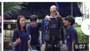
ค่ายวิทยาศาสตร์เคลื่อนที่ ครั้งที่ ๒๗ 51 views • 2 months ago