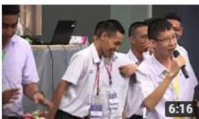
โอลิมปิกวิชาการ สอวน. ค่ายที่ ๒/๒๕๖๐ มหาวิทยาลัยบูรพา 132 views • 1 month ago