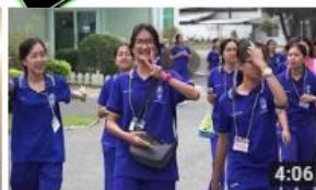
ค่ายวิทยาศาสตร์ โรงเรียนเบญจมราชรังสฤษฎ์ จังหวัดฉะเชิงเทรา 79 views • 2 months ago