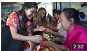
ประเพณีตรุษสงกรานต์ คณะวิทยาศาสตร์ ประจำปี ๒๕๖๑ 59 views • 2 weeks ago