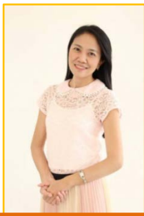
ภาควิชาจุลชีววิทยา