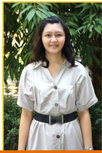
ภาควิชาคณิตศาสตร์