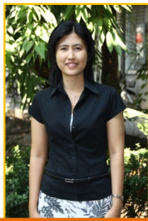
ภาควิชาคณิตศาสตร์